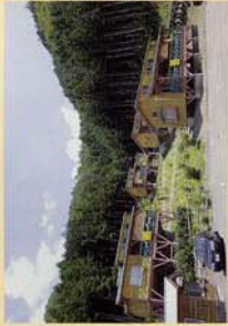
自然がたろそ。 食くて遊べる施設も。