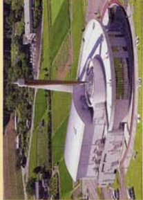
高さ約70m、世界最大級の 日産純正「今何時？」