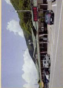
町自慢の野菜や漬け物 などを扱っています。