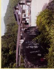
田舎ふるさと館 美並生活資料館ひろこま。