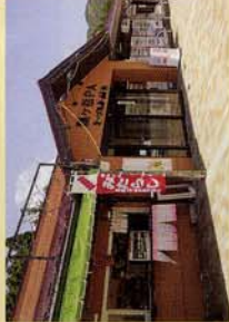
東海北陸自動車道の サービスエリアです。