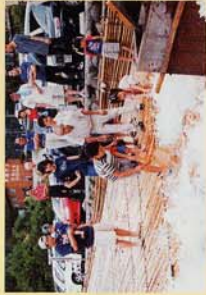
町の歴史を辿り、 新鮮な産物も召し上がれ。